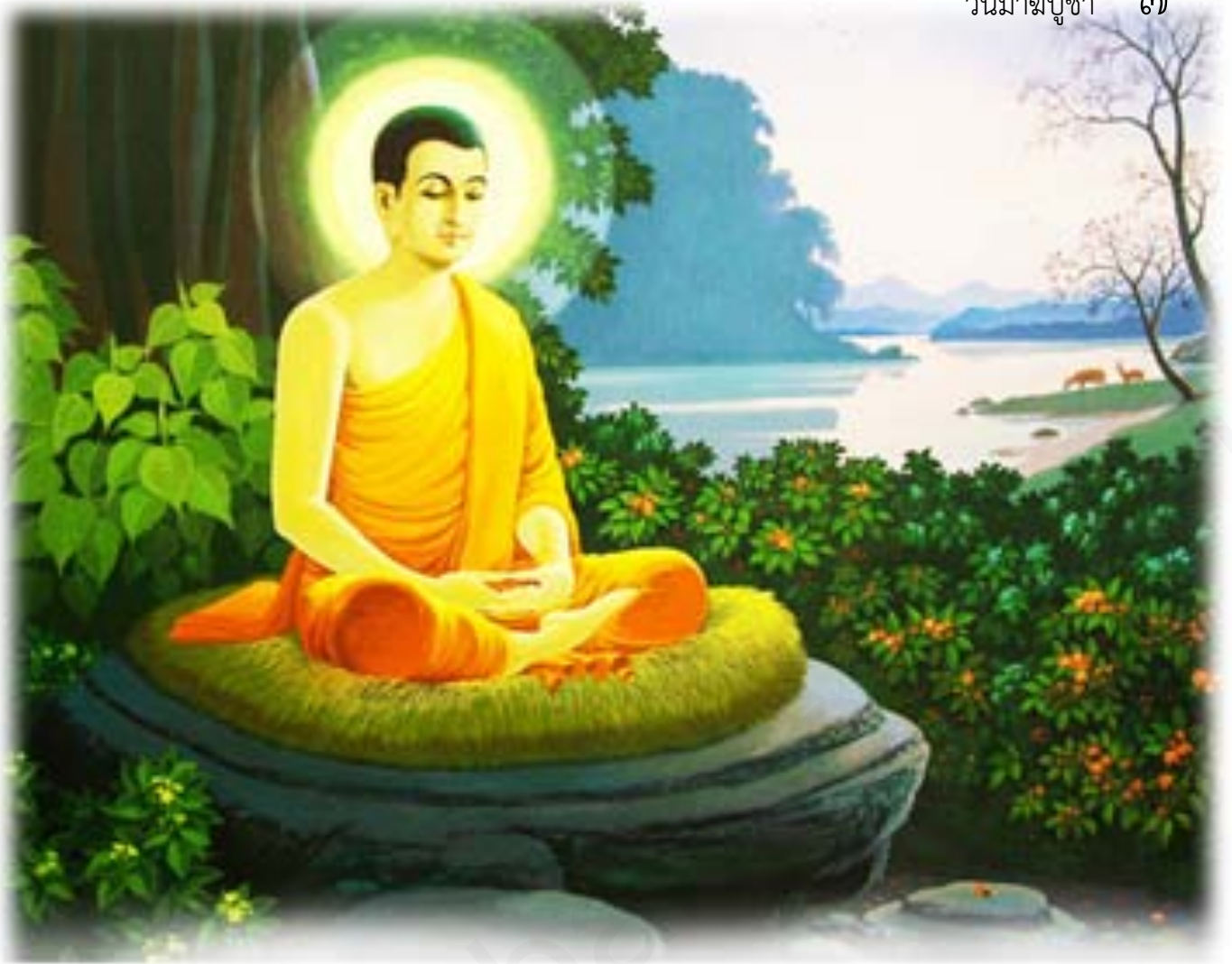
ภาพที่ ๑ : พระสัมมาสัมพุทธเจ้าตรัสรู้