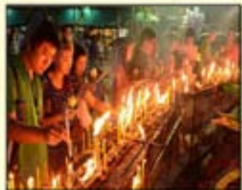
ภาพที่ ๖ : การเวียนเทียนในวัดในวันมาฆบูชา