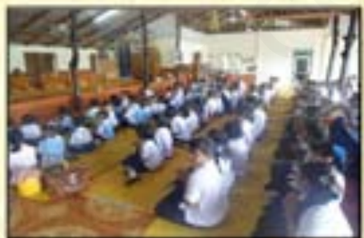
ภาพที่ ๕ : การปฏิบัติตนในวันมาฆบูชา

กิจกรรมต่าง ๆ ที่ควรปฏิบัติในวันมาฆบูชา ในตอนเช้า ควรไปทำบุญตักบาตร รักษาศีล ปฏิบัติธรรม หรือจัดสำหรับ ควาหวานไปทำบุญถวายภัตตาหาร ช่วงบ่าย ไปฟังพระ แสดงพระธรรมเทศนา เจริญสมาธิภาวนา