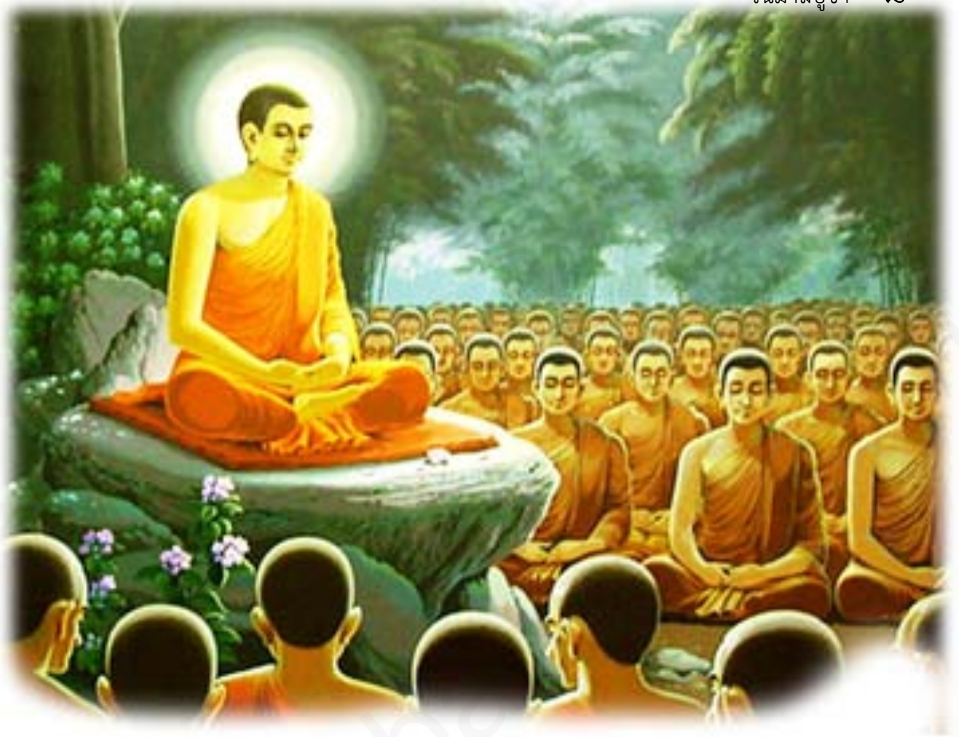
ภาพที่ ๒ : พระสัมมาสัมพุทธเจ้าทรงแสดงโอวาทปาติโมกข์