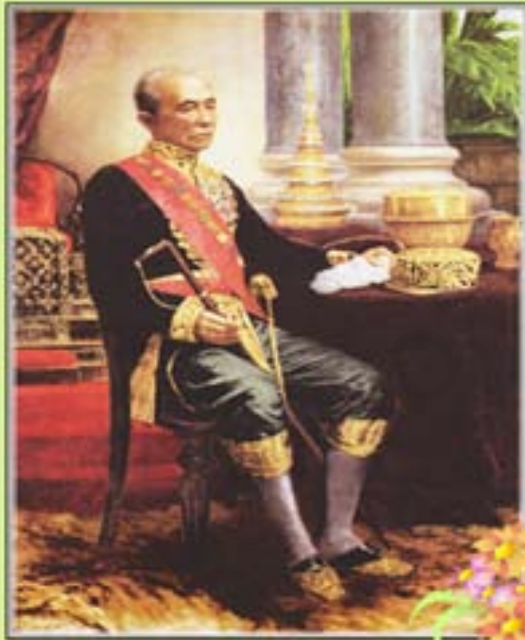
ภาพที่ ๙ : พระบาทสมเด็จพระจอมเกล้าเจ้าอยู่หัว รัชกาลที่ ๔