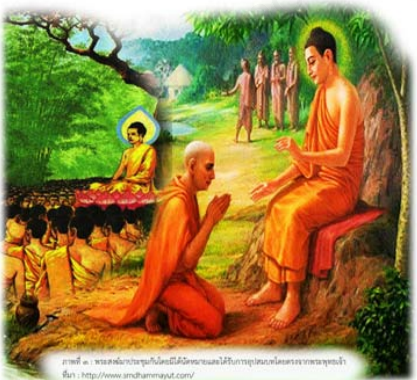
ภาพที่ ๓ : พระสงฆ์มาประชุมกันโดยมิได้นัดหมายและได้รับการอุปสมบทโดยตรงจากพระพุทธเจ้า ที่มา : http://www.smdhammayut.com/

วันมาฆบูชาเกิดเหตุอัศจรรย์ขึ้นพร้อมกัน ๔ ประการ คือ ๑. วันนั้นตรงกับวันเพ็ญ ขึ้น ๑๕ ค่ำ เดือน ๓ ซึ่งพระจันทร์เสวยมาฆฤกษ์ ๒. มีพระสงฆ์จำนวน ๑,๒๕๐ รูป มาประชุมพร้อมกันโดยมิได้นัดหมาย ณ วัดเวฬุวัน เมืองราชคฤห์ แคว้นมคธ เพื่อสักการะพระสัมมาสัมพุทธเจ้า ๓. พระสงฆ์ที่มาประชุมทั้งหมดล้วนล้วนเป็นพระอรหันต์ ผู้ได้อภิญญา ๖ ๔. พระสงฆ์ทั้งหมดได้รับการอุปสมบทโดยตรงจากพระพุทธเจ้า หรือ เอหิภิกขุอุปสัมปทา